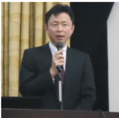
勝見審査委員会座長(京大・教授)より 結果発表・講評